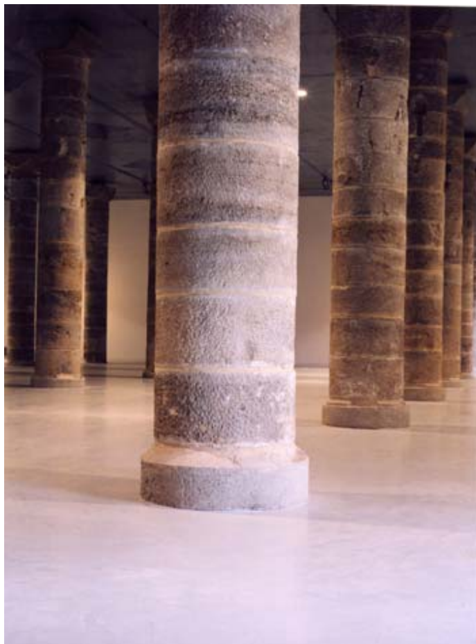
Planta 0, Centre d'Art la Panera