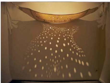
Eulàlia Valldosera Hamaca , 1991 Hamaca de cotó i focus Ed 3 ex 170 x 350 cm

Aquesta obra pertany a la sèrie de treballs "El melic del món" que prenien com a detonant l'acte de fumar, amb el component de plaer i de rebuig que conté pel seu caràcter additiu. Per tal de portar endavant el que ella mateixa anomenava "ecologia del cos", l'artista recrea diferents parts del seu cos, tot dibuixant-lo i aplicant-hi forats curosament fets mitjançant les puntes de cigarretes. En definitiva, es tracta de la ritualització d'un acte quotidià que tant li serveix per instigar la seva pròpia addicció com per incidir en certs aspectes de la feminitat.