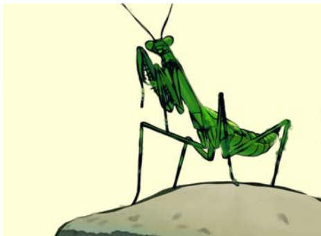
Mantis , 2003