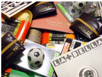
La Más Bella