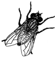
Antoni Abad. Projecte Z , 2001