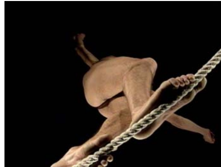
Antoni Abad. Últimos deseos , 1999