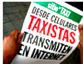
Antoni Abad. Sitio*TAXI , 2004