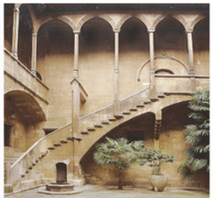
Antic Hospital de Santa Maria