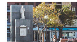
Plaça de Ricard Vinyes