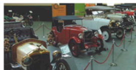
Museu Roda Roda

Museu RODA RODA: dissabte, de 10 a 13 i de 16 a 20 h. Divendres i festius. De 10 a 13 h