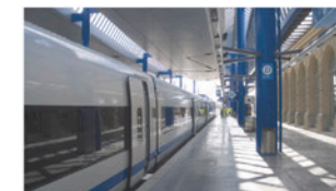
Interior estació AVE