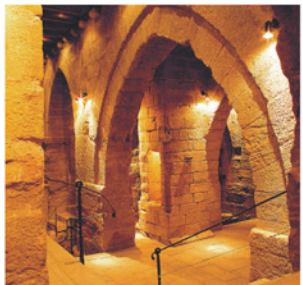
Restes arqueològiques del Palau de la Paeria