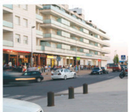
Illa de l'Oci