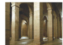
Dipòsit de l'Aigua