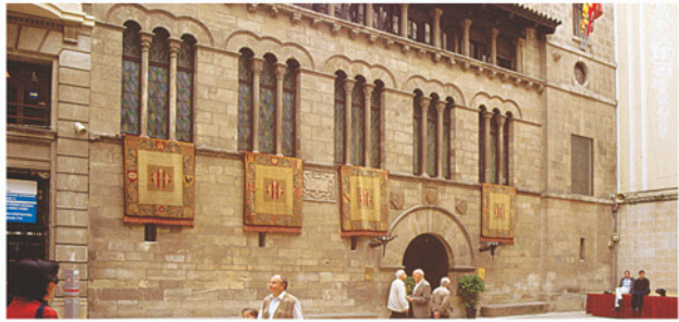
Palau de la Paeria