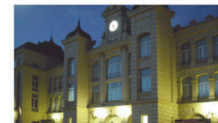
Estació de Renfe