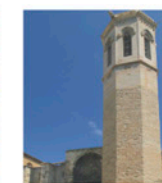
Església de Sant Llorenç