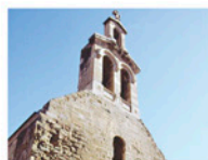
Església de Sant Martí

Dipòsit de l'Aigua: dimecres, dijous, divendres i festius de 10.00 a 13.00 h. Dissabtes de 10.00 a 13.00 h i de 16 a 20 h. Entrada gratuïta presentant el <<pass>> del bus turístic. Església de Sant Martí: de dimarts a dissabte de 10.00 a 13.30 h i de 18.00 a 20.00 h. Diumenges i festius de 10.00 a 13.30 h. La Panera: de dimarts a dissabte de 10.00 a 14.00 h i de 16.00 a 20.00 h. Diumenges i festius de 10.00 a 14.00 h.