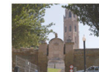
Porta del Lleó