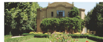
Xalet dels Camps Elisis