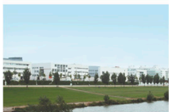
Nou campus universitari