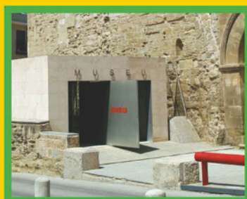
Museu de Lleida Diocesà i Comarcal