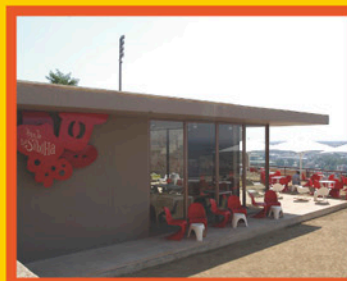
Bar de la Sibil·la