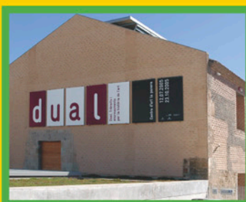
Centre d'Art La Panera

L'exposició és conjunta entre el Centre d'Art La Panera i el Museu de Lleida Diocesà i Comarcal, que cedeix part de la seva important col·lecció als dos espais: l'església romànica de Sant Martí i la Panera.