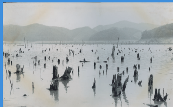
Desolação. c. 1950

Dos copias de época, acompañadas de sus correspondientes hojas de contacto, que ejemplifican el estilo experimental y el espíritu humanista que caracterizaron la obra de Palmira Puig (Tàrraga, 1912-Barcelona, 1978), una figura recientemente redescubierta y que formó parte de la vanguardia fotogràfica brasileña durante los años cincuenta junto con su marido, el también fotógrafo Marcel Giró.