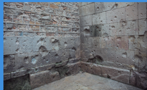
Sota la llum del mar (Església de Sant Felip Neri I). 2019