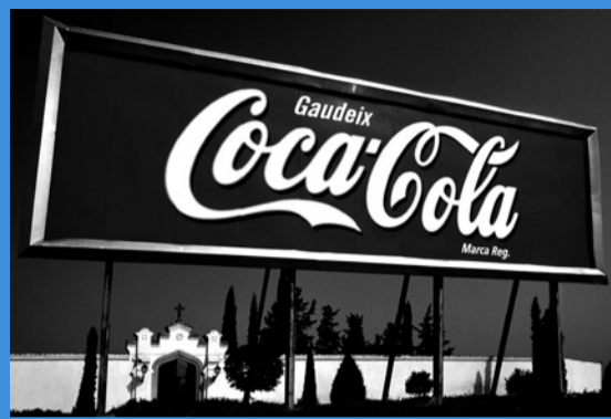
Perifèria Oest III. 2014-2020