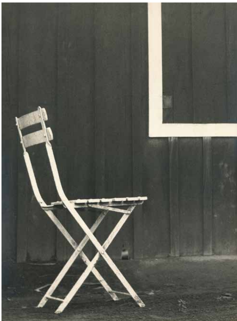
Palmira Puig: Estudo , c. 1950.

Del 14 de juliol a l'11 de setembre de 2022