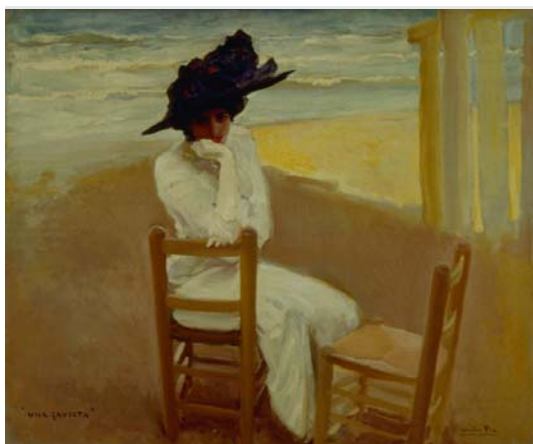
Cecilio Pla Una gaviota

Per a fer realitat aquest ambiciós projecte es comptarà amb adequats suports documentals com manuscrits, mapes, llibres, etc. i una significativa sèrie d'obres d'art provinents de: Victoria & Albert Museum, la Österreichische Nationalbibliothek, el Museu Arqueològic Nacional, el Museu nacional d'Arts Decoratives, El Museu Nacional del Prado, el Musée Goya de Castres, el Kunsthistorisches Museum de Viena, el Archivio di Stato de Nàpols, el Archivo General de Simancas, les Reials Acadèmies d'Història i de Belles Arts, entre d'altres.