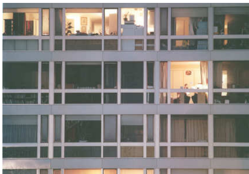
Ana Malagrida, S/T , 2002

L'arquitectura transparent contenia unes il·lusions de gran abast. D'alguna manera, la glaskultur pretenia operar com la pedrera de principis des dels quals crear solucions tipològiques per a les noves metròpolis. La realitat, però, ha estat ben diferent: l'arquitectura moderna desitjosa d'idear autèntiques «màquines d'habitar» ha estat el model amb què s'han resolt solucions matusseres per a la urbanització de la major part de les perifèries. L'arquitectura de la glaskultur sembla que ja només perviu a petita escala