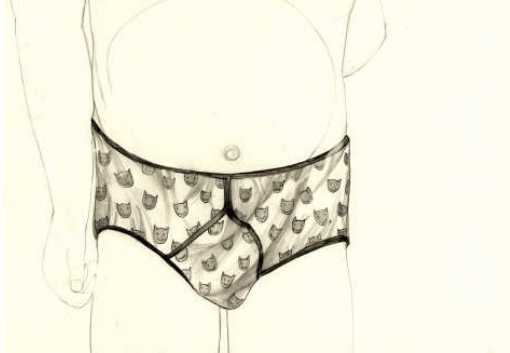
Marc Bauer, Constructing intimacy (hipòtesis II), 2003

l'aparador, en l'interior de l'experiència contemporània també és possible reconèixer una gestió de la transparència com a suport per legitimar un tipus d'exhibicionisme, una teatralització d'allò privat, ara descobert a la mirada col·lectiva, per repensar la mateixa idea de l'espectacular.