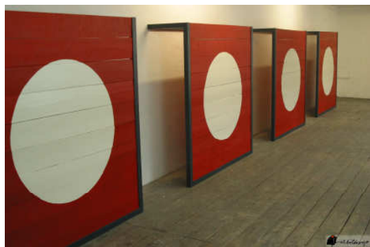
Fabrice Gygi, Protect Paint , 2005 Kültur Buró Barcelona y el artista

L'apologia moderna de la transparència molt aviat s'ha pervertit en un pretext per a la vigilància. Per a aquest lleu moviment només ha calgut reconvertir l'estructura d'un espai transparent en un dispositiu panòptic, on allò transparent alimenta la possibilitat d'una visió de control. La transparència es dilueix en la visibilitat i el visible esdevé l'escenari d'allò vigilat. Amb aquesta equació, legitimada per la suposada necessitat d'incrementar les mesures de seguretat, l'arquitectura pot tornar a solucions opaques amb pròtesis tecnològiques