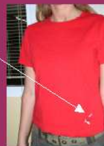
COLORS: GROC I VERMELL