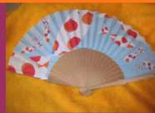
Ventalls 6 Euros