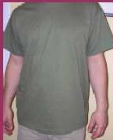
SAMARRETA HOME 12 Euros