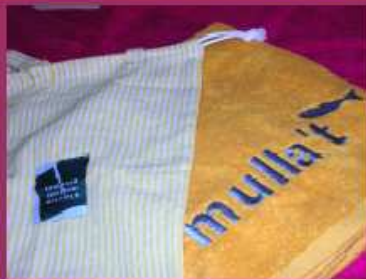
Tovallola + bossa 14 Euros