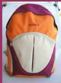
Motxilla 8 Euros