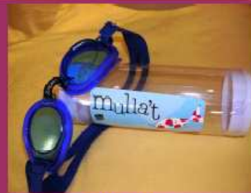
Ulleres piscina 5 Euros