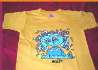
Samarreta nens 10 Euros Talles 4,6,8,14 Groga Kukulsumusu i Taronja