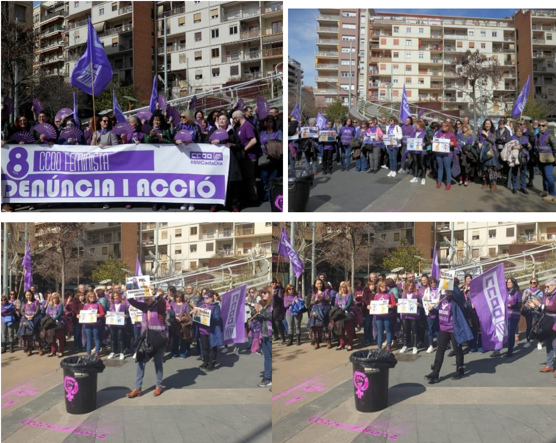
Fotos de la jornada i l'acció reivindicativa del 8 de Març del 2023 a CCOO de les Terres de Lleida