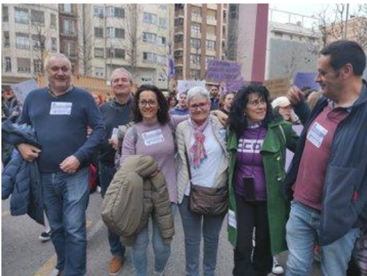
Participació de CCOO de les Terres de Lleida a la manifestació del 8-M del 2023 de Marea Lila a Lleida