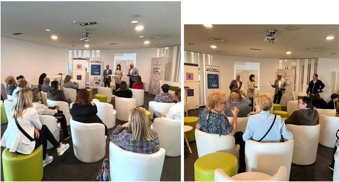
Acte de cloenda del projecte DonaValor de la COELL