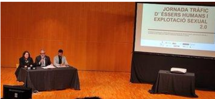
19 d'octubre, la jornada titulada "Tràfic d'éssers humans i explotació sexual 2.0"