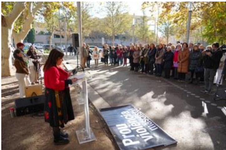
23/11/2023. Acte institucional unitari el Dia Internacional per a l'Eliminació de la Violència contra les Dones