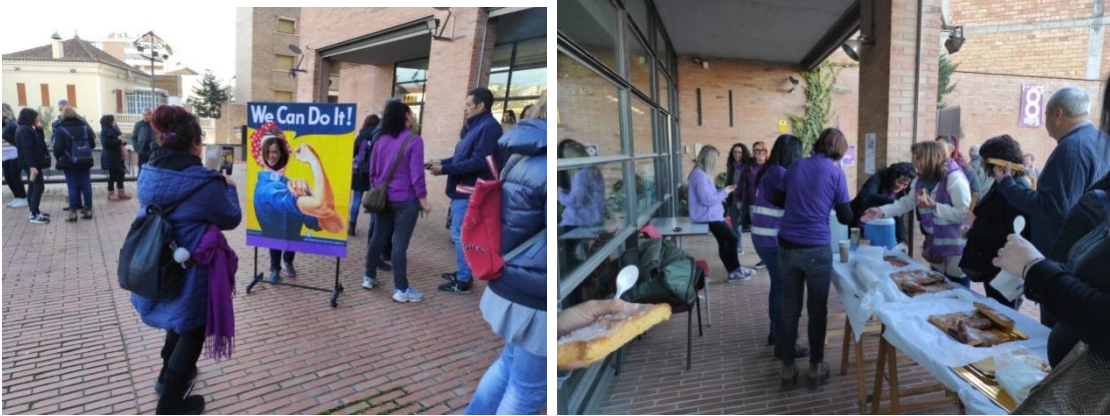
Fotos de la jornada i l'acció reivindicativa del 8 de Març del 2023 a CCOO de les Terres de Lleida