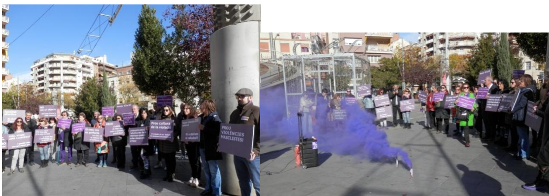
Dia Internacional per a l'Eliminació de la Violència vers les Dones, el divendres 24 que va consistir en un taller i en una concentració al carrer